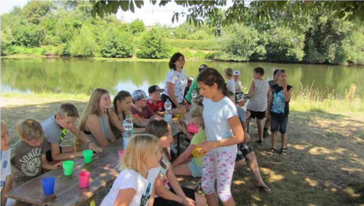
Erfrischungspause direkt am Fluss ...