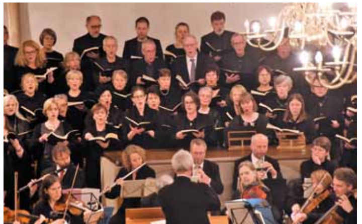
Motettenchor aus Lengerich