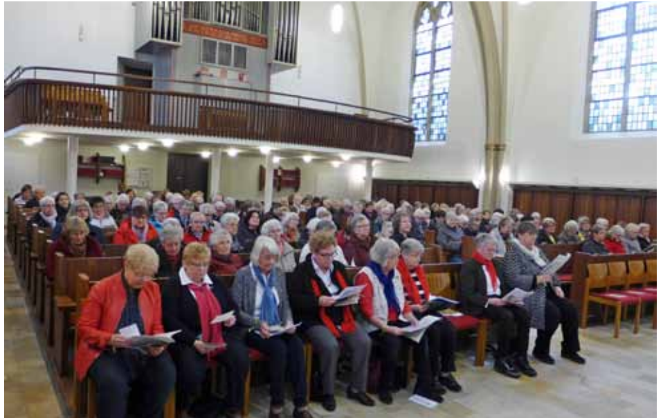
Vollbesetzte Jakobi-Kirche zum Weltgebetstag

I n über 170 Ländern der Welt wird immer am ersten Freitag im März ein besonderer Gottesdienst gefeiert. Vor über 130 Jahren taten sich christliche Frauen in den USA und Kanada im Sinne internationaler Frauensolidarität zusammen. Aus ihrem konfessions-übergreifenden Gebet ist die größte ökumenische Bewegung weltweit entstanden.