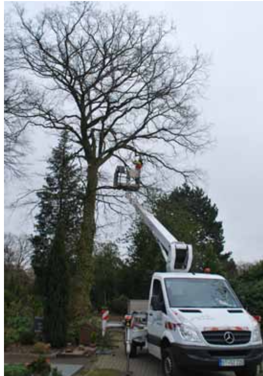
Spezialisten bei der Baumpflege