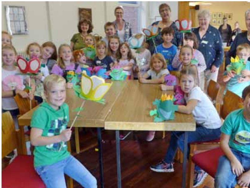
Immer gute Stimmung bei den Aktionstagen ...

Der nächste Aktionstag ist am 15. Juli von 10 bis 14 Uhr im Gemeindehaus, Münsterstraße 54. Das Motto des Tages wird noch festgelegt - aber vielleicht schreibt ihr euch schon einmal diese Veranstaltung in euren Kalender.