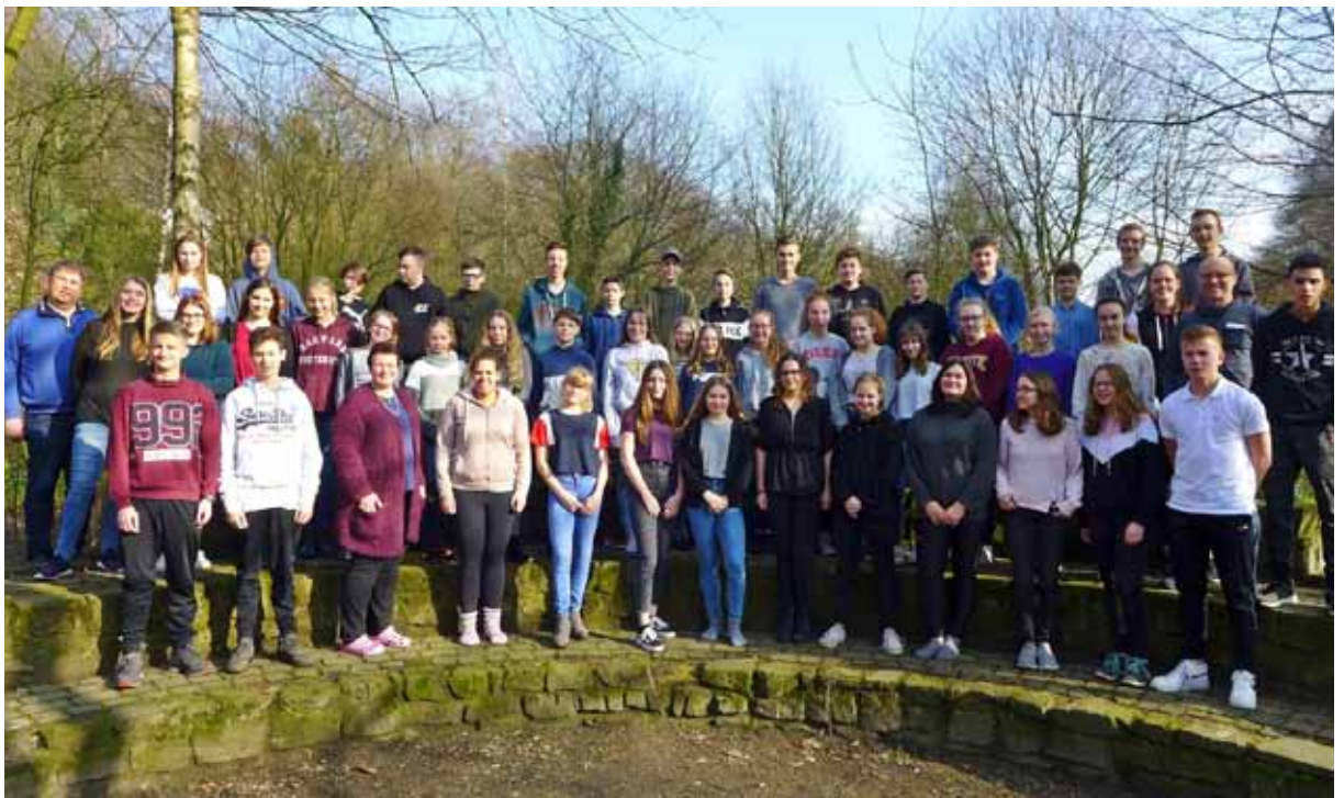
Wetterlage und Stimmung heiter bis freundlich

So beschäftigten sich die Konfirmandinnen und Konfirmanden in Tecklenburg mit den Fragen: „Wer bin ich eigentlich? Was mag ich - und was nicht? Was kann ich gut – und was fällt mir eher schwer? Was denke und empfinde ich? Was wünsche ich mir für meine Zukunft? Wie und wer möchte ich eigentlich sein?“