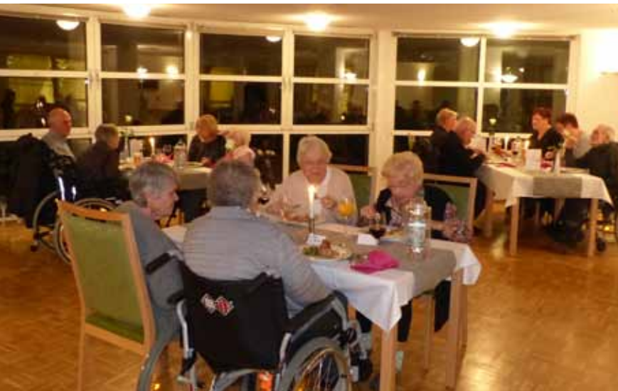
Festliche Atmosphäre beim Gala-Abend

I m Jakobi Altenzentrum wird jedes Jahr ein Gala-Abend für alle Bewohnerinnen und Bewohner angeboten. Insgesamt finden drei Abende statt, separat für jeden Wohnbereich.