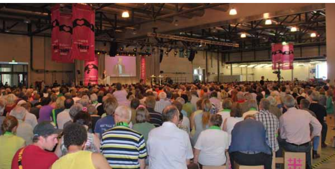
Großveranstaltungen in der Halle ...

jeweiligen Region in der Regel deutlich über zwanzig Millionen Euro aus. Die Stadt Berlin, wo der vorige Kirchentag stattfand, bezifferte den Wert des Kirchentages für sich sogar mit 63 Millionen Euro. Der Kirchentag in Dortmund wird über 19 Millionen Euro kosten. Geld kommt von der gastgebenden westfälischen Landeskirche, vom Land Nordrhein-Westfalen, von Sponsoren, Spendern und natürlich wird auch ein Teil der Kosten mit Ein-