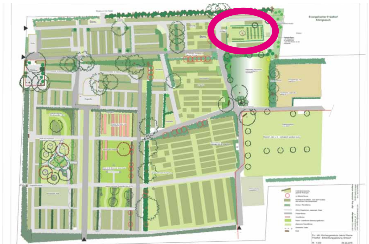
Hier wird das Grabfeld für pflegefreie Rasengräber neu gestaltet